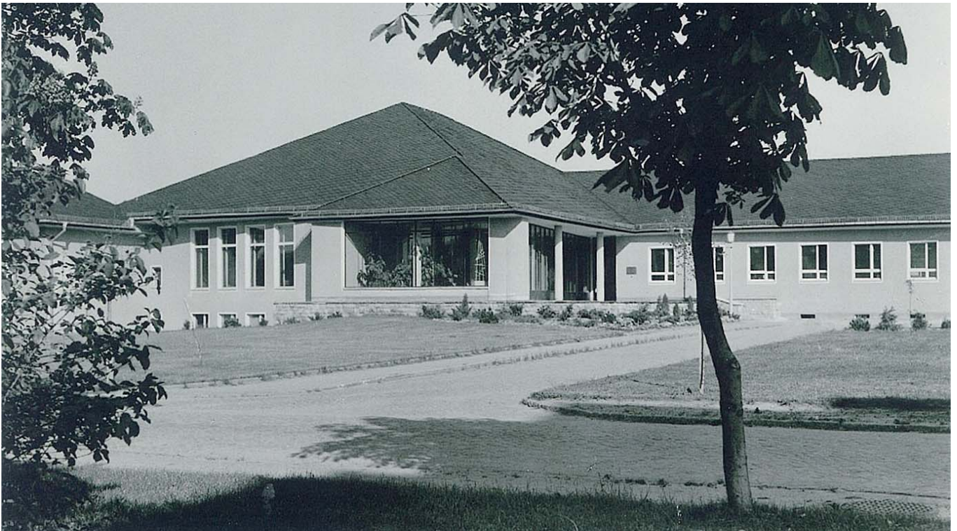
Abb. 4 1957 - Teil der Vorderansicht mit Haupteingang (Terrasse und Treppe noch ohne die späteren Eisengeländer), Vordergrund: Roßkastanien (Altbestand), andere Straßenseite: Birken-Neupflanzungen