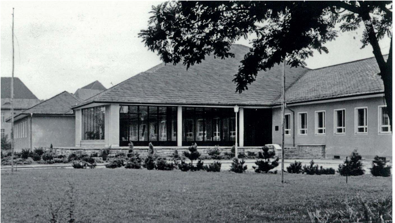
Abb. 3 1957 - Teil der Vorderansicht mit Haupteingang (Terrasse und Treppe noch ohne die späteren Eisengeländer) rechts ein Exemplar der Robinien-Allee auf dem Vorplatz (Altbestand), später gefällt