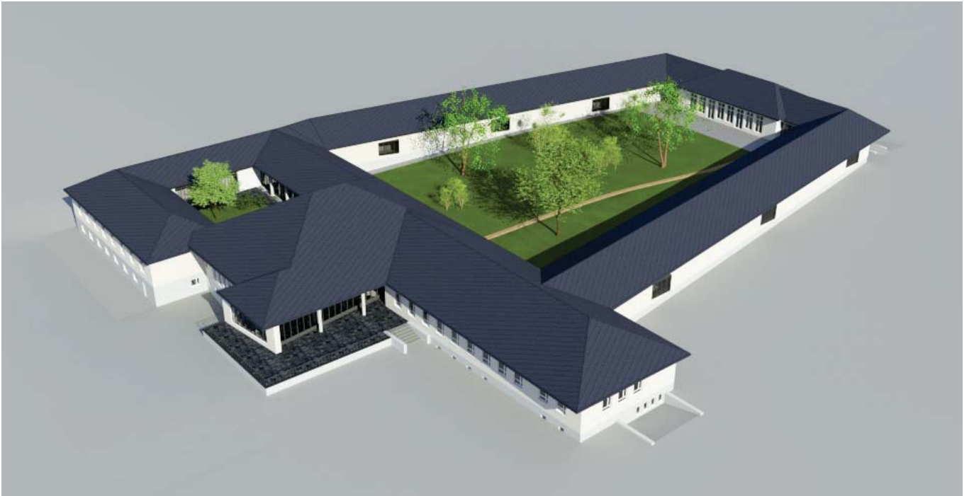
Abb. 1 | 2013 / Illustration Haus 34 durch Plan 3D Laserscan + Modell UG (haftungsbeschränkt)

Ehemaliges Institut für kortiko und viszerale Pathologie und Therapie (zuletzt Franz Volhard- Klinik)